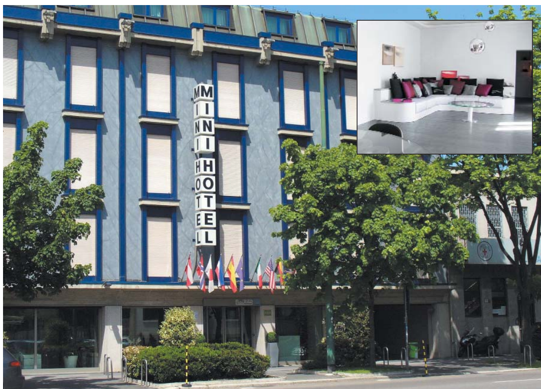
La facciata del Minihotel La Spezia.

All'interno del patrimonio immobiliare esistente si vuole, in vista dell'Expo 2015, rinnovare le proprietà ritenute più strategiche: il Minihotel Portello, ed è in programma anche il Minihotel Tiziano (Buonarroti) inserito in